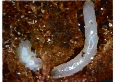
Рис. 8. Личинка короедницы (справа) и ее жертва – куколка полиграфа (слева)