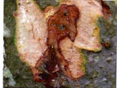
Рис. 3. Углубленные в заболонь куколочные камеры уссурийского полиграфа на пихте сибирской

Puc. 4. Некроз тканей луба пихты сибирской, вызванный офиостомовыми грибами на месте попытки поселения полиграфа