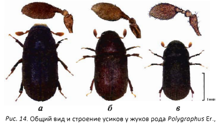
Рис. 14. Общий вид и строение усиков у жуков рода Polygraphos Cr. питающихся на пихте в Сибири: a – P. proximus Blandf.; 6 – P. poligraphus L.; в – P. subopacus Thoms.