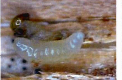
Puc. 7. Личинка Dinotiscus eupterus, питающаяся личинкой уссурийского полиграфа